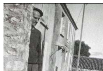
Art brut et singulier à Nice