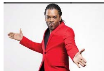
Du rire sur quatre jours