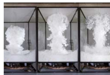
Un nuage de barbe à papa ascensionnel aux Ponchettes