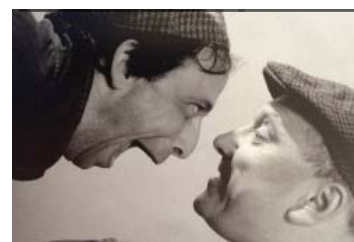
Imagination sans relâche