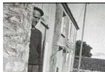
Art brut et singulier à Nice